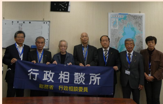
令和3年10月 大津行政なんでも相談所