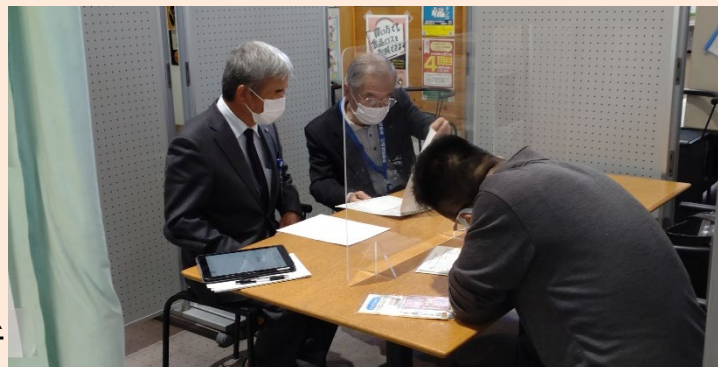
令和4年10月 栗東市役所巡回相談所