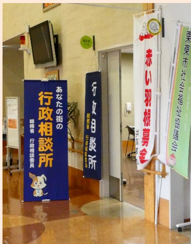
栗東市総合福祉保健センター において定例相談所を開設