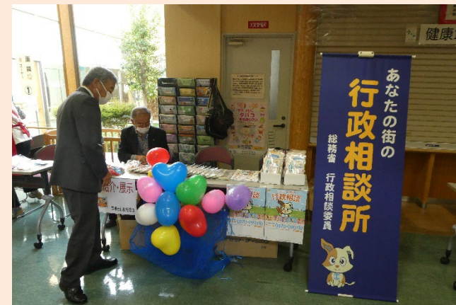
令和4年10月 ボランティアなごやかまつり