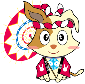
行政相談マスコット キクーン