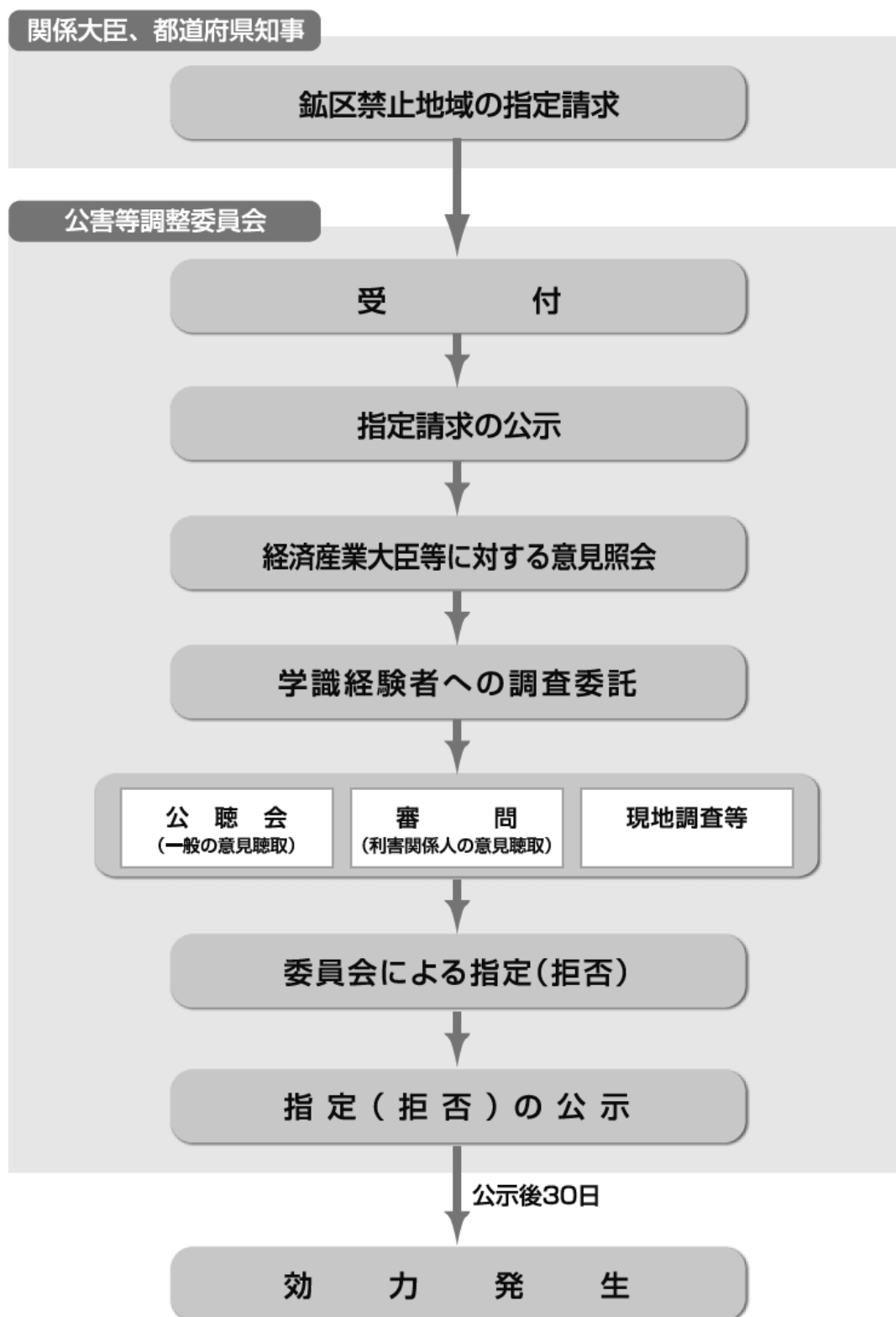
図 2 - 1 - 1 鉱区禁止地域の指定制度