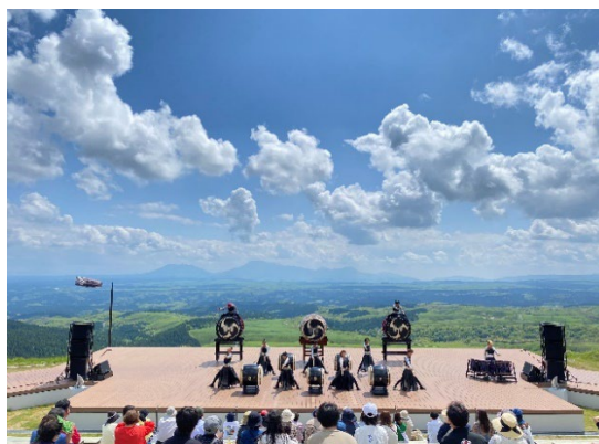
世界に冠たる天空劇場 TAOの丘