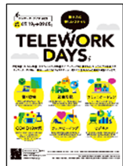
Cartel de los Días de Teletrabajo 2021