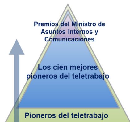
Programa de selección para los cien mejores pioneros del teletrabajo

Los cien mejores pioneros del teletrabajo